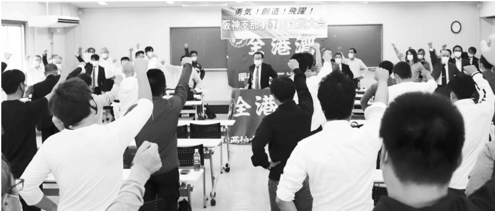
新体制で阪神支部、団結ガンバロー！！

2020.11.4 NO.642号 全港湾関西地方 阪神支部 大阪市港区築港 1-12-27 06-6574-8424 078-303-0800 全港湾は一人 でも入れます