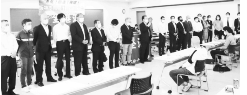
役員改選後、新執行部体制が確立した。