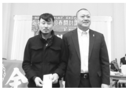
上組分会が金賞獲得！！

だ」と述べられました。河野書記長より「春闘は労働組合が一番活躍する時であり、たたかう労働組合として体調管理も大切で」と述べられ、春闘方針案の提案がありました。アベノミクスのもとで日本経済の行き詰まりがいつそ鮮明になっていることを踏まえて、国民生活向上の課題を第一歩に据え、職場と国民の世論づくりを行う。生計費に基づく組合員討議をしっかりと行い、付帯要求を確立するとともに期日までの要求提出やスト権の確立、機関誌の発行等やるべきことをしっかりとやり、要求実現に向け粘り強くなつたか。すべての働く人の賃金引上げ・実質賃金の改善、最低賃金の引上げ、労働法制改悪反対、格差是正、均等待遇、労働時間短縮の実現、9条改憲阻止、戦争する国づくり反対、消費税減税・社会保障の充実を、都構想・カジノ誘致反対、維新の強権政治ストップ、住民と労働者の声が届く行政を、また安全衛生部門で昨年、全港灣の組合員の死亡災害が発生しました。こいつたことが二度とないよう安全対策の強化、さらに台風による津波や高潮など自然災害に対する防災マニュアル整備、人命の安全確保を最優先とした対策に引き続き取