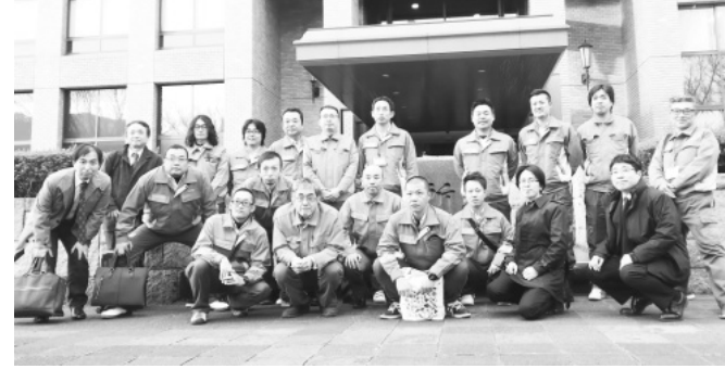
日興サービス原告団と弁護団

職場と分かれ、主尋問では 日検が秘密裏に請負契約か ら派遣契約に切り替えた が、各職場での作業の指揮 命令系統は請負契約時から 変わらず直接日検や倉庫会 社であることや、日検の地 域職員制度が全国港灣で反 対されており、指定事業体 の労働者が日検の一方的な 選考を前提とせず本体へ移 籍を求める事を証言しま した。 日検側からの反対尋問 では日興サービスと日検 で現状の労働条件に遜色 無いので移籍しなくても 良いのではないかと。日検 は定年60歳なので定年63 歳としている日興サービ スの方が条件は良いので はないか等の事を聞かれ ましたが、日興サービス の労働条件は全港灣での 運動の末に賃金改定した ものであり、それでも日