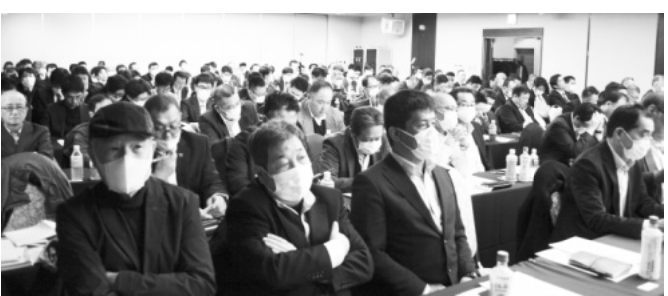
参加者にマスク姿が目立つ

と2020年度184、500円とするこの2段階構えの要求でたたかうことを決定しました。