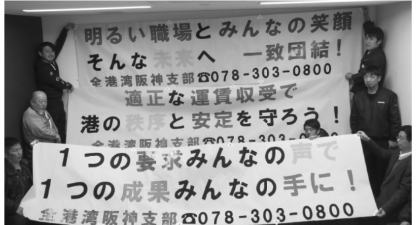
ブロック会議にて完成品のお披露目

航し審査は3次選考まで至りました。例年は作成時間を考えて短い文言を選出しがちですが、今回は長文となりましたが納得の秀作だと自負しています（上記枠内参照）。