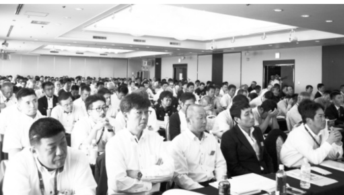
全国から総勢237名が参加