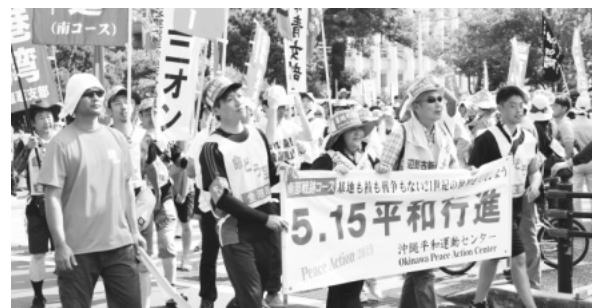
基地も核も戦争もいらない

1氏が当選した事、続く県 民投票で「辺野古埋め立て 反対」が多数を占めたこと で沖縄の民意はあきらか です。しかし、政府は日本全 体の問題として真摯に取り 組んでいるようには見えま